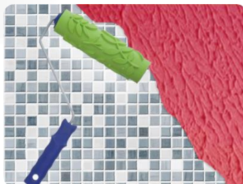
Rolo tipo carimbo