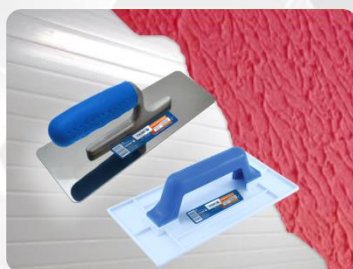
Desempenadeira plástica e aço