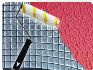
Rolo de lã