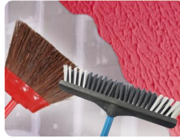
Vassoura de pelo ou piaçava